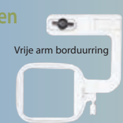
Vrije arm borduurring